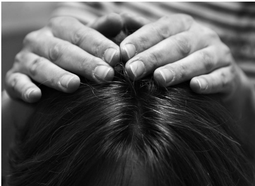
Beispiel – Segen

Beispiel Segensformeln: „Der Herr segne dich und behüte dich, der Herr lasse sein Angesicht leuchten über dir und sei dir gnädig. Der Herr hebe sein Angesicht über dich und gebe dir Frieden.“ Diese Segensformeln werden bis heute im Judentum und Christentum verwendet.